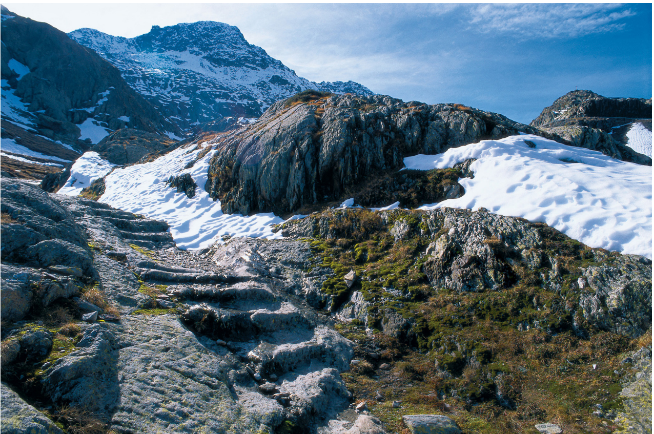
Via Francigena: au-dessus du Plan de Barasson.

Le réseau d'itinéraires culturels en Suisse a défini le parcours de la Via Francigena selon le parcours entrepris par Sigéric, archevêque de Canterbury, en 990. En Suisse les étapes officielles sont Yverdon-les-Bains, Orbe, Lausanne, Vevey, Aigle, Saint-Maurice, Orsières et Bourg-Saint-Pierre. Afin de rendre le parcours plus agréable à la découverte du pays, d'autres lieux d'étapes sont venus agrémenter le parcours du voyageur.